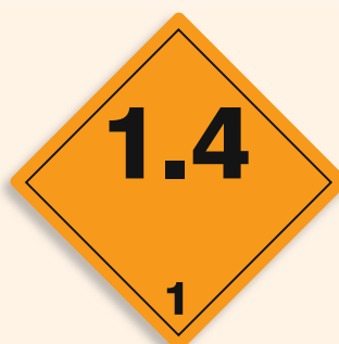
Folie C1101005 Papier C1101005-PP Explosiv (Unterklasse 1.4)