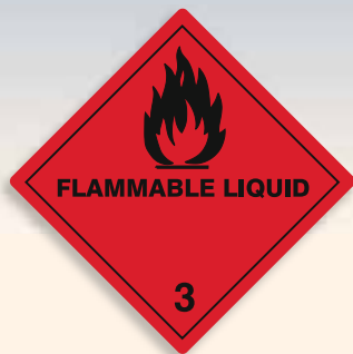
Folie C3101002 | Papier C3101002-PP Entzündbare flüssige Stoffe