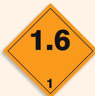
Folie C1101010 | Papier C1101010-PP Explosiv (Unterklasse 1.6)