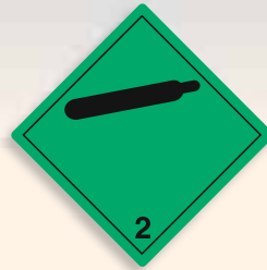
Folie C2101003 | Papier C2101003-PP Nicht brennbares, nicht giftiges Gas