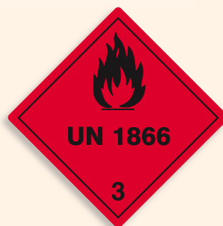
Folie C3101866 | Papier C3101866-PP Entzündbare flüssige Stoffe (Harzlösung)