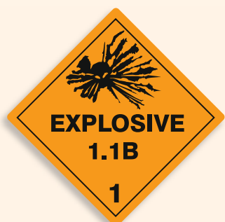
Folie C1101003 Papier C1101003-PP Explosiv (Verträglichkeitsgruppe 1.1B)