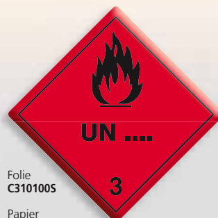
Folie C3101005 Papier C3101005-PP