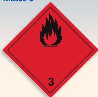
Folie C3101001 | Papier C3101001-PP Entzündbare flüssige Stoffe