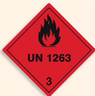
Folie C3101263 | Papier C3101263-PP Entzündbare flüssige Stoffe (Farbe oder Farbzubehörstoffe)