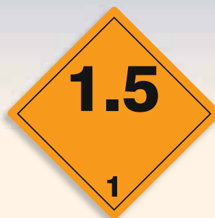
Folie C1101008 | Papier C1101008-PP Explosiv (Unterklasse 1.5)