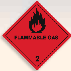
Folie C2101002 | Papier C2101002-PP Brennbares Gas