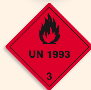
Folie C3101993 | Papier C3101993-PP Entzündbarer, flüssiger Stoff

24h Versandfertig Bei Bestellungen werktags bis 12:00 Uhr wird die Ware am gleichen Tag noch versendet!