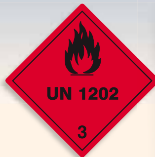
Folie C3101202 | Papier C3101202-PP Entzündbare flüssige Stoffe (Diesel)