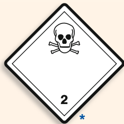
Folie C2101005 | Papier C2101005-PP Giftige Gase