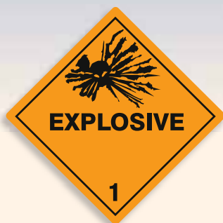
Folie C1101002 Papier C1101002-PP Explosiv