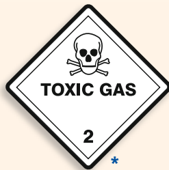
Folie C2101006 | Papier C2101006-PP Giftige Gase