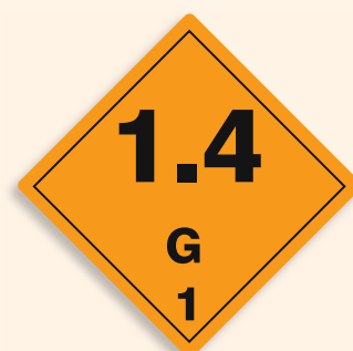
Folie C1101006 Papier C1101006-PP Explosiv (Unterklasse 1.4 Verträglichkeitsgruppe G)