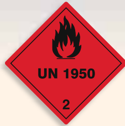
Folie C2101950 | Papier C2101950-PP Brennbares Gas (Druckgaspackung)