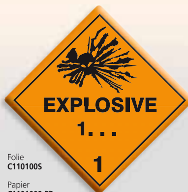
Folie C1101005 Papier C1101005-PP

Sonderanfertigung 2-3 Werkstage Versandfertig