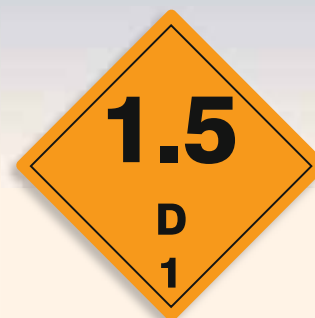
Folie C1101009 | Papier C1101009-PP Explosiv (Unterklasse 1.5 Verträglichkeitsgruppe D)