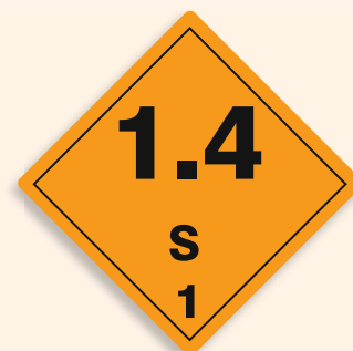
Folie C1101007 Papier C1101007-PP Explosiv (Unterklasse 1.4 Verträglichkeitsgruppe S)