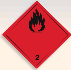
Folie C2101001 | Papier C2101001-PP Brennbares Gas