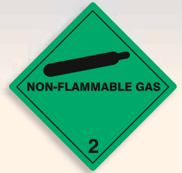
Folie C2101004 | Papier C2101004-PP Nicht brennbares, nicht giftiges Gas