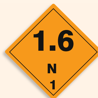
Folie C1101011 | Papier C1101011-PP Explosiv (Unterklasse 1.6 Verträglichkeitsgruppe N)