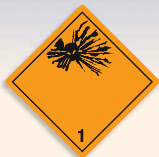
Folie C1101001 Papier C1101001-PP Explosiv