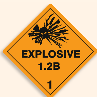
Folie C1101004 Papier C1101004-PP Explosiv (Verträglichkeitsgruppe 1.2B)